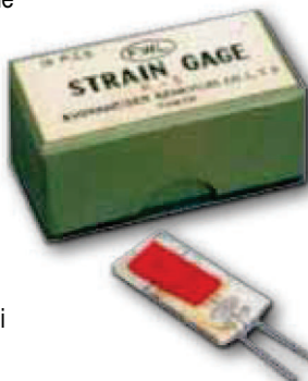
Una delle prime confezioni di estensimetri a filo introdotti da KYOWA nel 1949

le applicazioni di misura delle deformazioni dei materiali e di analisi delle sollecitazioni.